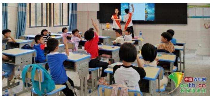
图为梦飞天使志愿服务队教育关爱小分队为希望学校一年级的学生上《花园种花》。