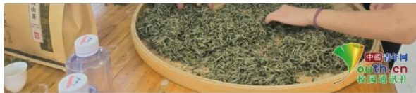
图为制茶师傅带领梦飞天使志愿服务队员体验和学习下党茶产业。