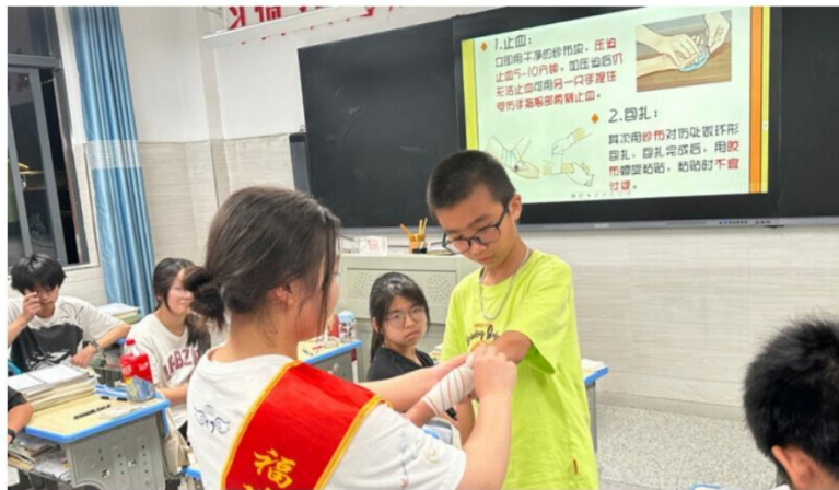
【中青校园网】护理学院暑期三下乡，暖心义诊进社区，健康知识普校园