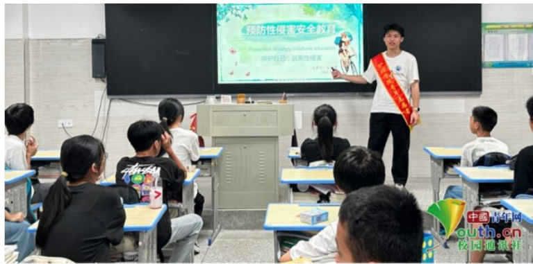
图为梦飞天志愿服务队成员为宁德县下党希望学校学生开展预防性侵害教育。