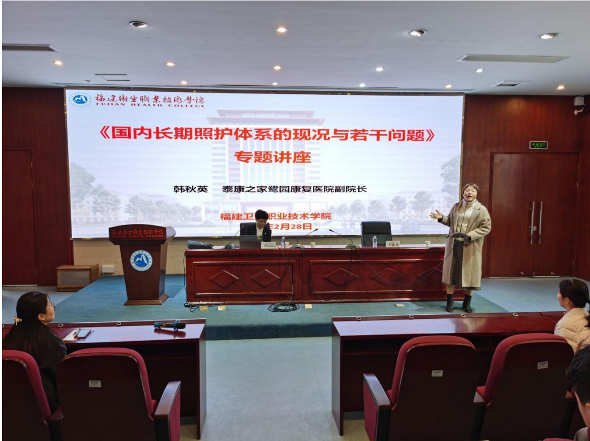
行业专家来校进行行业讲座