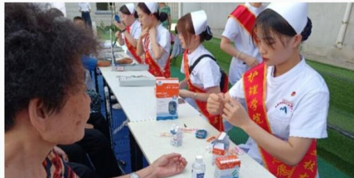
【中国青年网】健康中国梦，行动暖人心

中国青年网三明7月10日电（通讯员 林松清）为充分利用大学生资源，为乡村振兴增砖添瓦，6月29日下午，福建卫生职业技术学院护理学院，梦飞天使志愿服务队队员在城东社区开展集体义诊活动，此次义诊主要包括血压测量、血糖测量、海姆立克急救法、绷带以及三角巾包扎，同时，队员现场为群众介绍一些如高血压、糖尿病、流行感冒等常见疾病的相关知识。