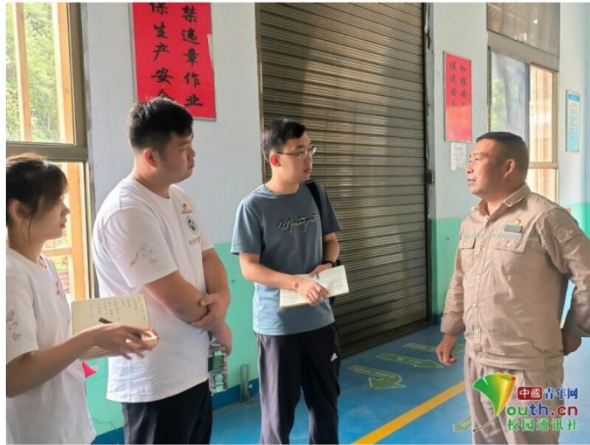
图为梦飞天使志愿服务队向当地居民了解下党乡村振兴发展情况。