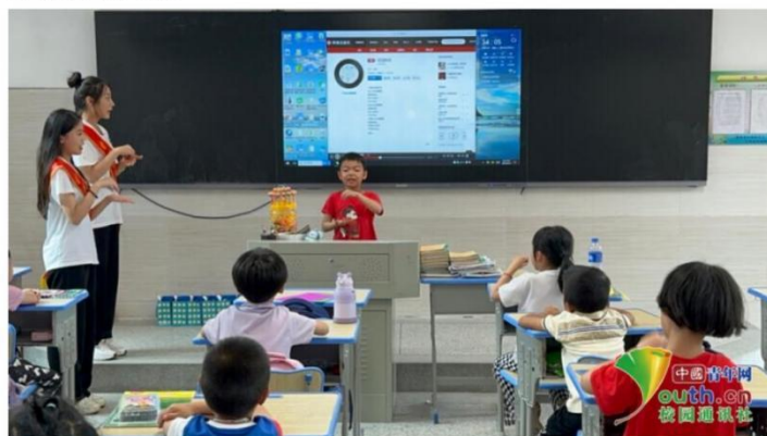
图为队员邀请一位小朋友上台为大家展示。