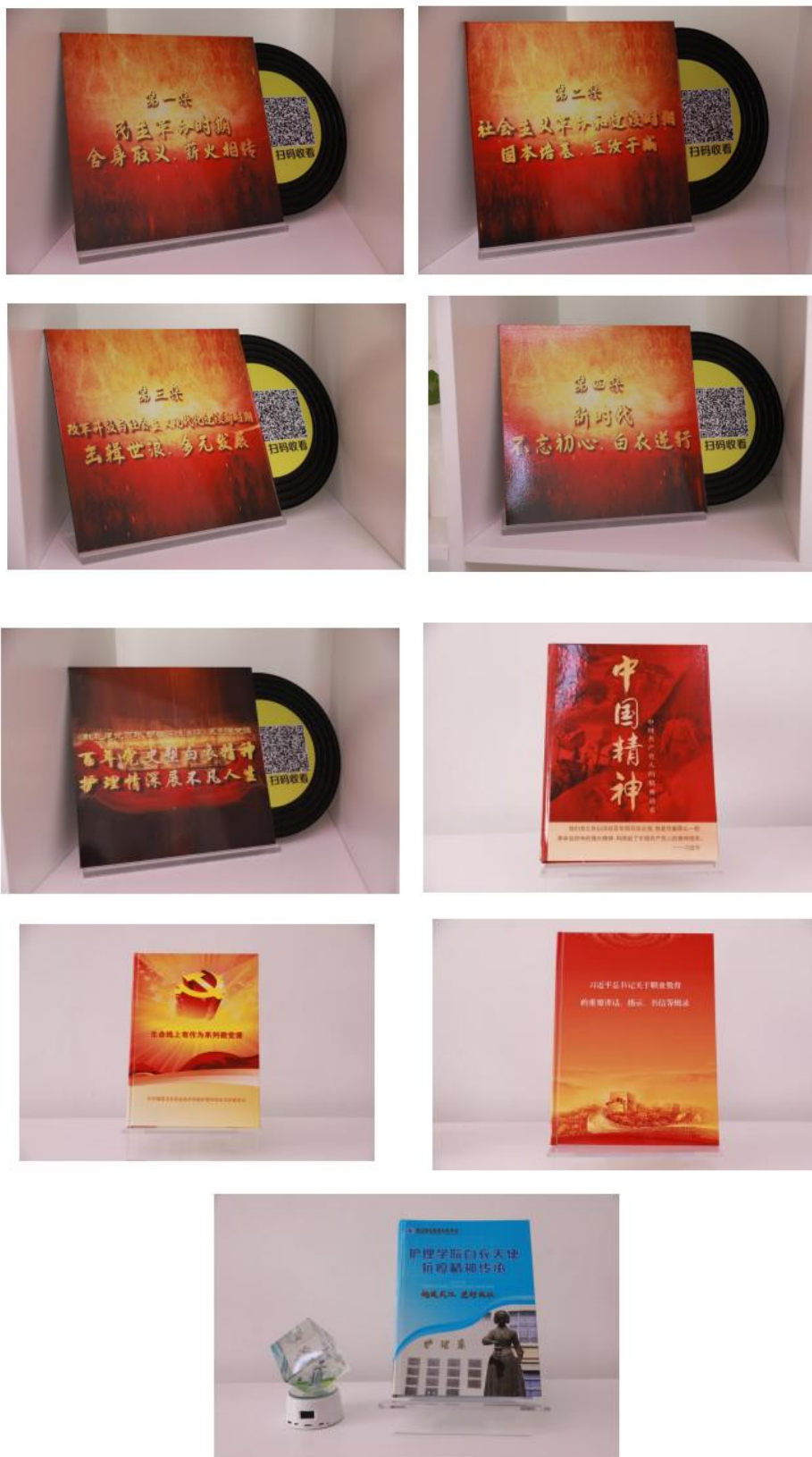
“红色书屋”自编党性教材