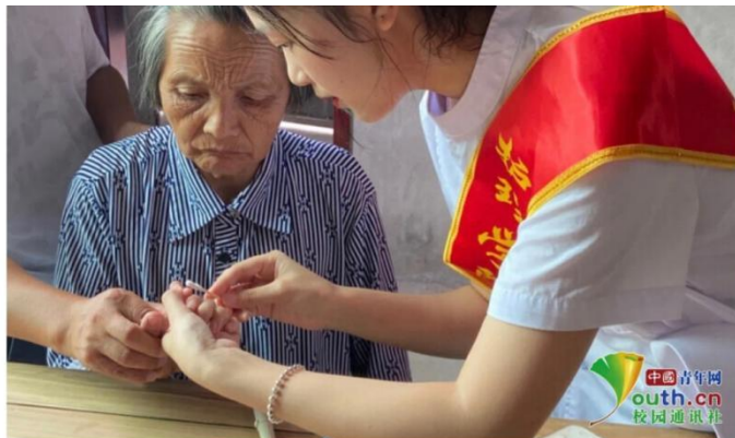
图为梦飞天使志愿服务队入户为村民进行测血糖。