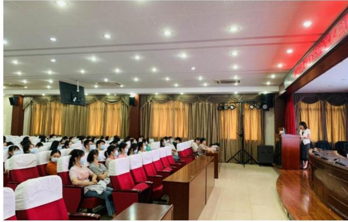
福州市第二医院实习生党史学习