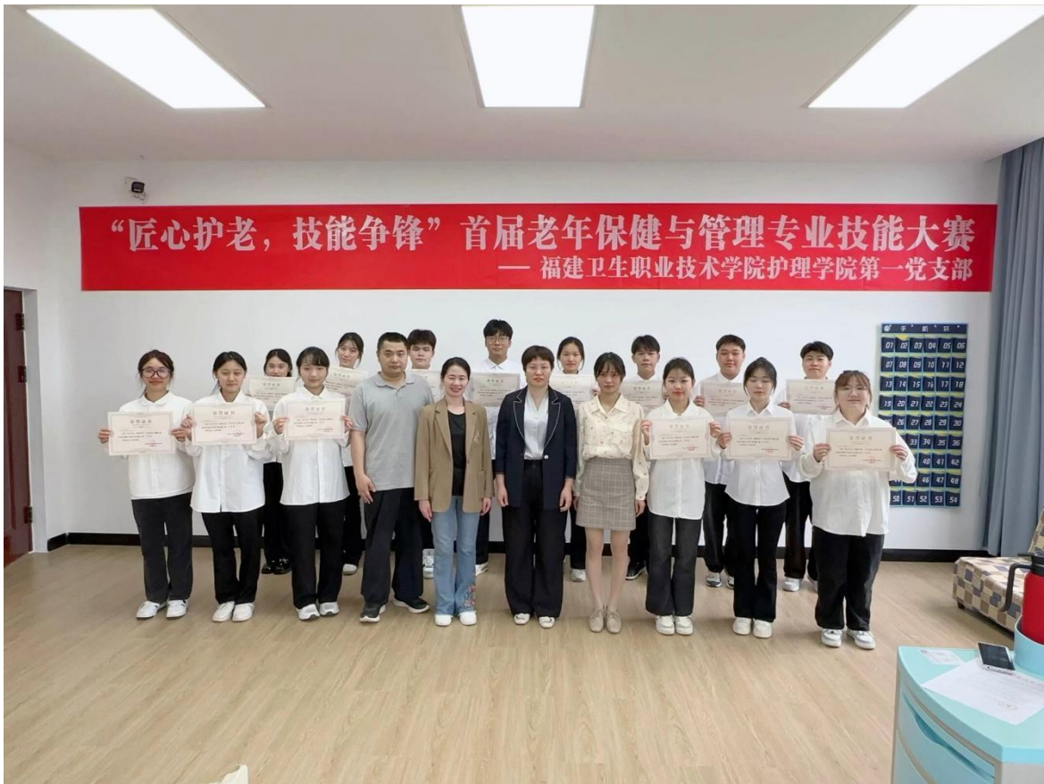
院领导积极参与新专业的建设与发展