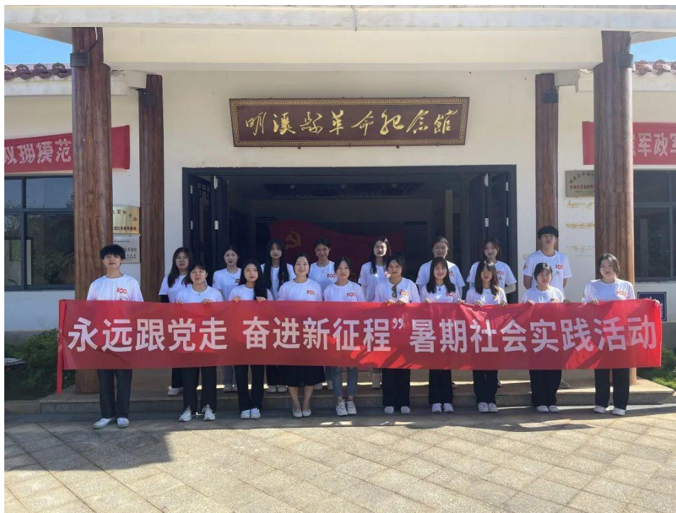
2022年6月28日，在明溪县当地讲解员的带领下参观明溪县革命纪念馆、归化正当红展馆。聆听讲解员介绍的革命故事，重温了峥嵘岁月。